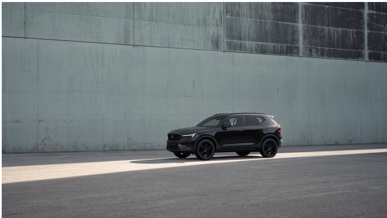
XC40 Black Edition Ultra Exteriér

Pomocí tohoto kódu můžete svůj návrh sdílet s prodejcem Volvo