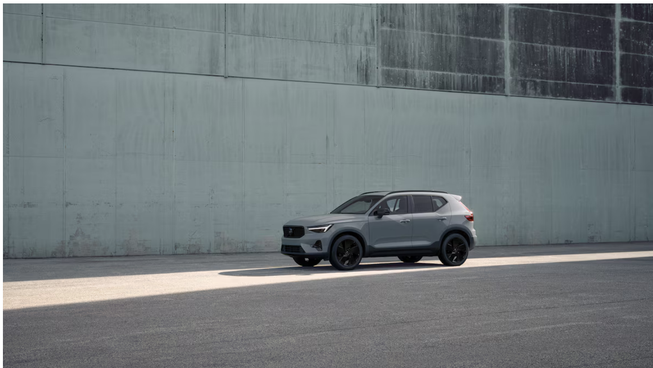
XC40 Black Edition Plus Exteriér

Pomocí tohoto kódu můžete svůj návrh sdílet s prodejcem Volvo