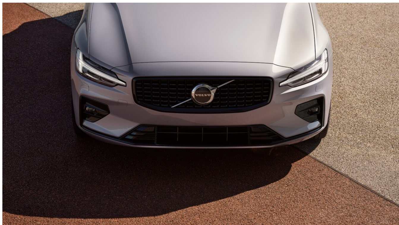
V60 Dark Plus Exteriér

Pomocí tohoto kódu můžete svůj návrh sdílet s prodejcem Volvo